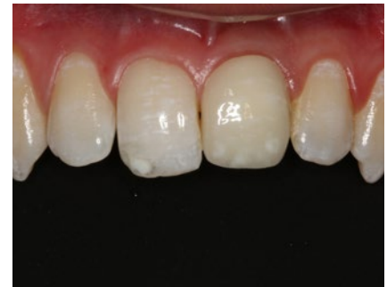
Abb. 10 und 11 Wachstumsschub. Eingliederung der dritten Vollkeramikkrone im Alter von 15 Jahren und 7 Monaten (Aufnahmen vom 15.08.2014)