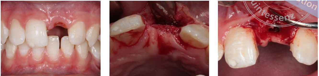
Abb. 3 bis 5 Nach kieferorthopädischer Vorbehandlung und prospektiver Implantatplanung 5-D-Implantation im Alter von 14 Jahren und 9 Monaten (Aufnahmen vom 25.10.2013)

Prospektive Implantatversorgung nach traumatischem Frontzahnverlust beim wachsenden Patienten mit dem 5-D-Konzept