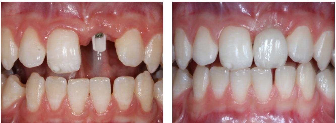
Abb. 6 und 7 Eingliederung der ersten Vollkeramikkrone im Alter von 14 Jahren und 11 Monaten. Marginaler Überschuss an Hart- und Weichgewebe – Wachstumspotenzial bei mesiofazialen Wachstumsmuster des Mittelgesichts (Aufnahmen vom 20.12.2013)

wurde bei Beginn der lateralen Atrophie am 25.10.2013 im Alter von 14 Jahren und 9 Monaten implantiert. Die einsetzende laterale Atrophie ist das stärkste Signal der beginnenden Inaktivitätsatrophie und der späteste Zeitpunkt für die Implantation, wenn die Eckzähne in ihrer definitiven Position eingestellt sind (Abb. 3 bis 5).