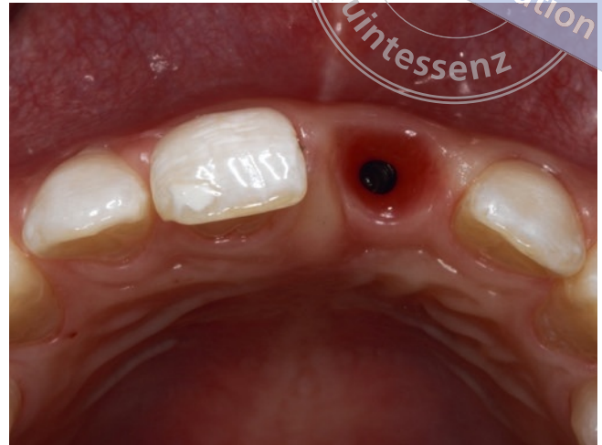
Abb. 13 und 14 Abnehmen der Krone und Abformung für prothetische Neuversorgung; perfektes Emergenzprofil (Aufnahmen vom 27.02.2018)