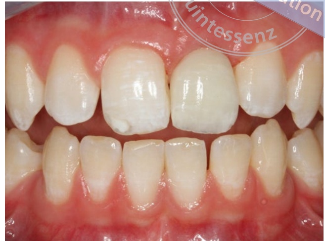
Abb. 8 und 9 Wachstumsschub. Eingliederung der zweiten Vollkeramikkrone im Alter von 15 Jahren und 3 Monaten. Marginal Hart- und Weichgewebsüberschuss (Aufnahmen vom 25.04.2014)