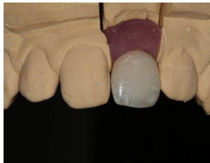
Abb. 22 und 23 Visualisierung des Wachstums. Erstes Modell von 2014 mit erster Krone aus dem Jahr 2014 und letztes Modell von 2018 mit erster Krone aus dem Jahr 2014