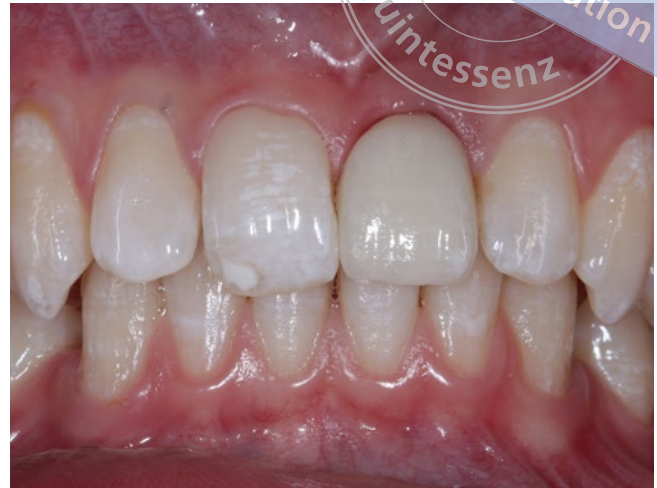
Abb. 20 und 21 Intraorale Eingliederung der ersten und der dritten Krone zur Demonstrierung des Wachstums (Aufnahmen vom 08.03.2018)