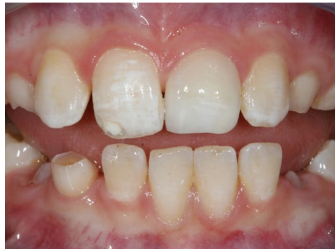
Abb. 1 und 2 Frontzahntrauma im Alter von 11 Jahren und 7 Monaten. Palatinale Längsfraktur und Pulpa aperta an beiden Pulpenhörnern des Zahnes 21. Wurzelkanalaufbereitung, Versuch der Zahnerhaltung, keramischer Eckenaufbau (Aufnahmen vom 17.08.2010)

Um einen Alveolenkollaps zu verhindern, wurde eine Socket Preservation mit xenogenem Knochenersatzmaterial (Bio-Oss, Fa. Geistlich Pharma, Wolhusen, Schweiz) und autologem Knochen in partikulärer Form durchgeführt. Als Provisorium diente eine zweiflügelige Adhäsivbrücke.