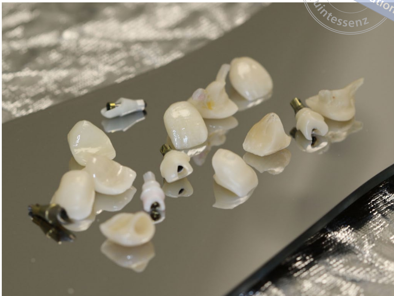
Abb. 26 Zusammenstellung der im Behandlungsverlauf von 2014 bis 2018 eingesetzten provisorischen Kronen

den Nachbarzähnen Attachment verloren, das sich nur schwer oder gar nicht rekonstruieren lässt. Mit einer frühzeitigen Implantation kann zwar der Knochen erhalten werden, aber es bestehen ebenfalls erhebliche Risiken, da die Implantate der komplexen dreidimensionalen Kiefer- und Alveolarfortsatzentwicklung nicht folgen 21,22 . Daraus können gravierende funktionelle und ästhetische Nachteile entstehen. Bernard et al. 7 konnten in einer retrospektiven Studie in einem 4-jährigen Beobachtungszeitraum eine Infraokklusion implantatgetragener Frontzahnkronen feststellen. Die Überlebensrate von Implantaten, die vor dem 13. Lebensjahr inseriert wurden, lag um ca. 20 % unter der-